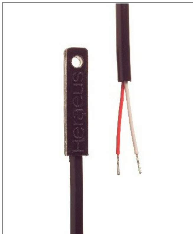
Das Bild dient nur zu Illustrationszwecken