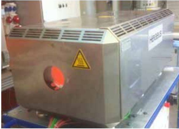
MAX-Ofen für den Durchlaufbetrieb