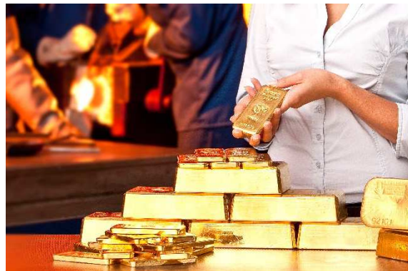
Recycling von Gold hat bei Heraeus einen hohen Stellenwert.

Unterm Strich steht: Gold ist nicht nur physisch beständig, es ist auch nachhaltig wertbeständig – und avanciert somit zu einem elementaren Bestandteil einer ausgewogenen Anlagestrategie. Das Goldvorkommen auf unserer Erde ist limitiert. Dies ist ein grundlegendes Argument dafür, dass die Investoren auf Werthaltigkeit setzen. Wie attraktiv Gold als Anlagegut ist, unterstreicht die Bedeutung in den Währungsreserven der Zentralbanken. So hält die Bundesbank ca. 3.400 Tonnen Gold in ihren Beständen. Dass Gold als Währungsreserve weiter attraktiv ist, unterstreicht die Meldung aus Ungarn. 31,5 Tonnen Gold wurden kürzlich den Währungsreserven zugefügt.