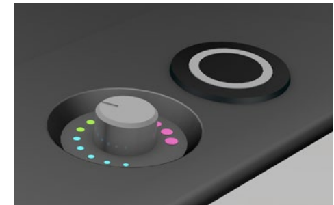
Einfache und sichere Bedienung