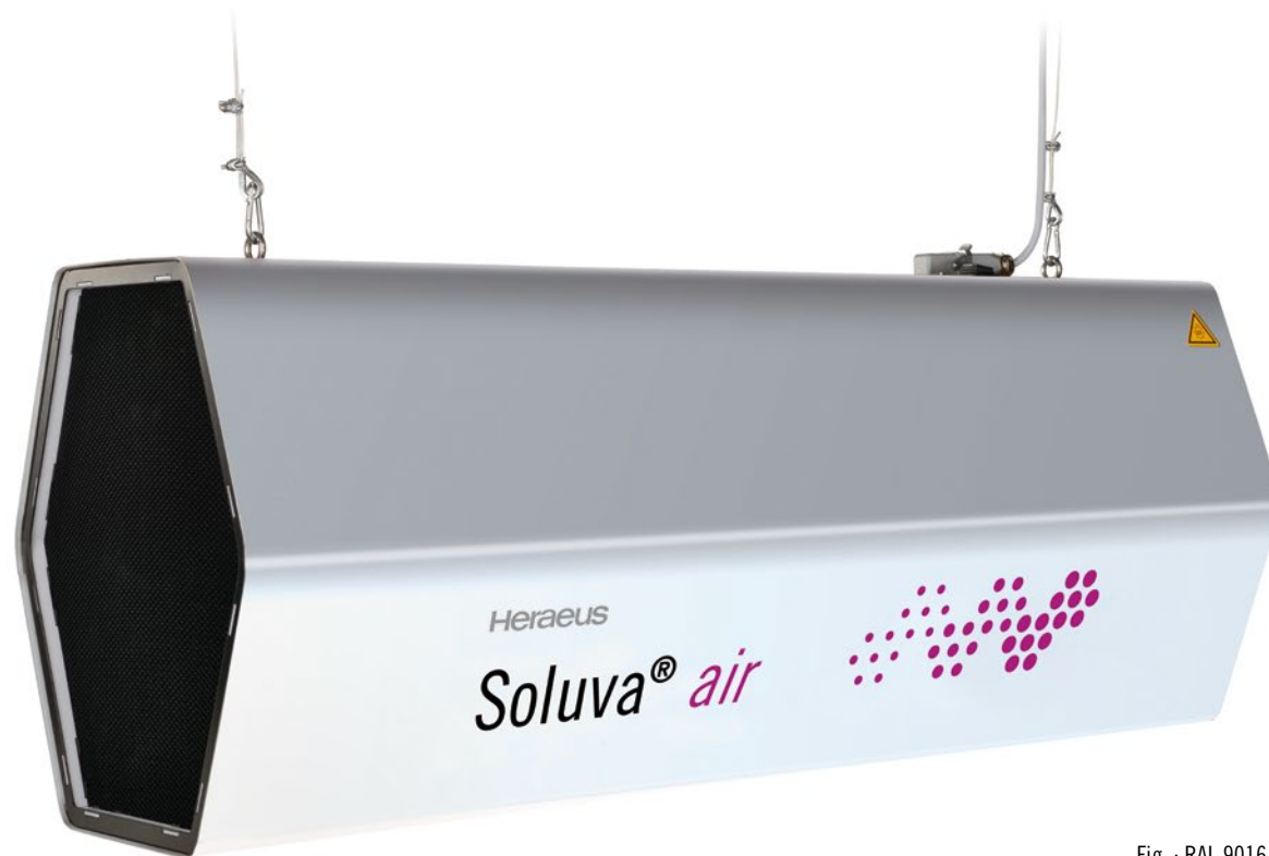
Fig. : RAL 9016 blanc trafic, couvercle : acier inoxydable brossé

La lumière UV d'une longueur d'onde de 200 à 300 nm divise l'ARN/ADN des virus tels que le Coronavirus et les autres micro-organismes et produit ainsi un fort effet désinfectant.